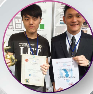
2016 Kaohsiung International Invention and Design EXPO (发明展)，荣获4项 第一名